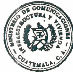
Eduardo Castillo Arroyo Ministro de Comunicaciones, Infraestructura y Vivienda

El Viceministro de Comunicaciones, Infraestructura y Vivienda